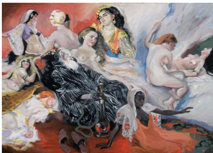
Isabelle Pierron, Les Tentations de Charles .