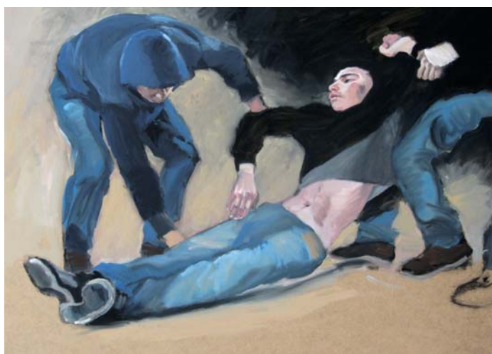
Isabelle Pierron, Tunisie 2011 , gouache, 60 x 80 cm.